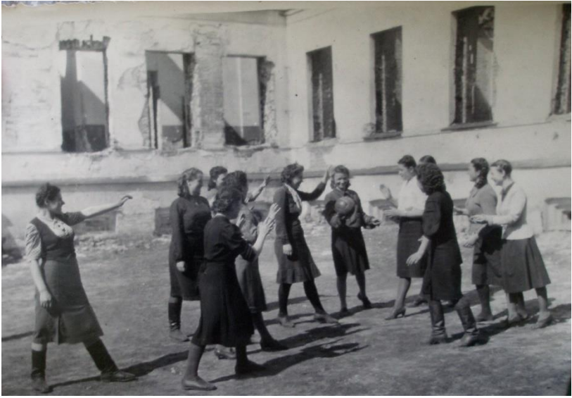
Студентки повоєнних років у дворі напівзруйнованої будівлі по вул. Сковороди, 14.